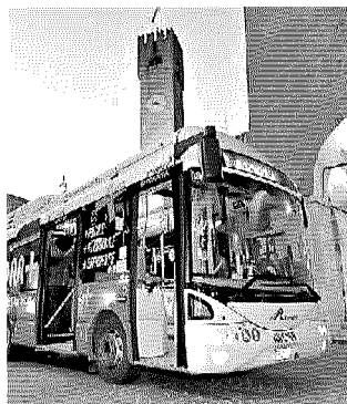
BUS IN COMMISSIONE Il presidente Mom ieri a Ca' Sugana